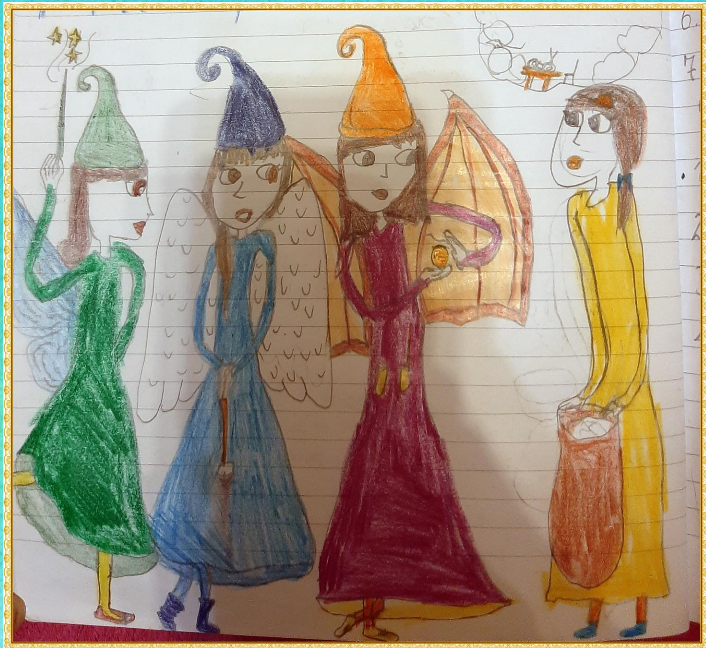
Ramona Bilić, 3.a